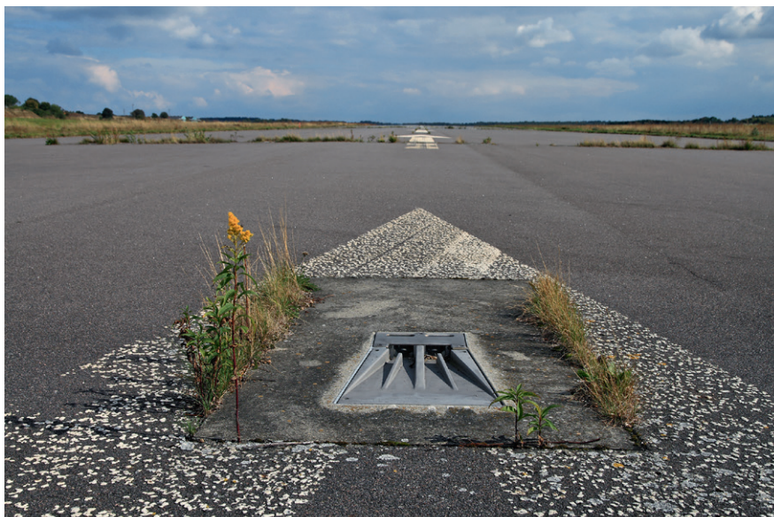
Inde på flyvestationen er naturen så småt begyndt at erobre startbanen tilbage.

Men de to kommuner nåede aldrig at acceptere aftalen, før sagen tog en dramatisk vending. Danmarks Naturfredningsforening besluttede i december 2005 at rejse fredningssag på 440 hektar for at bevare den særprægede natur.