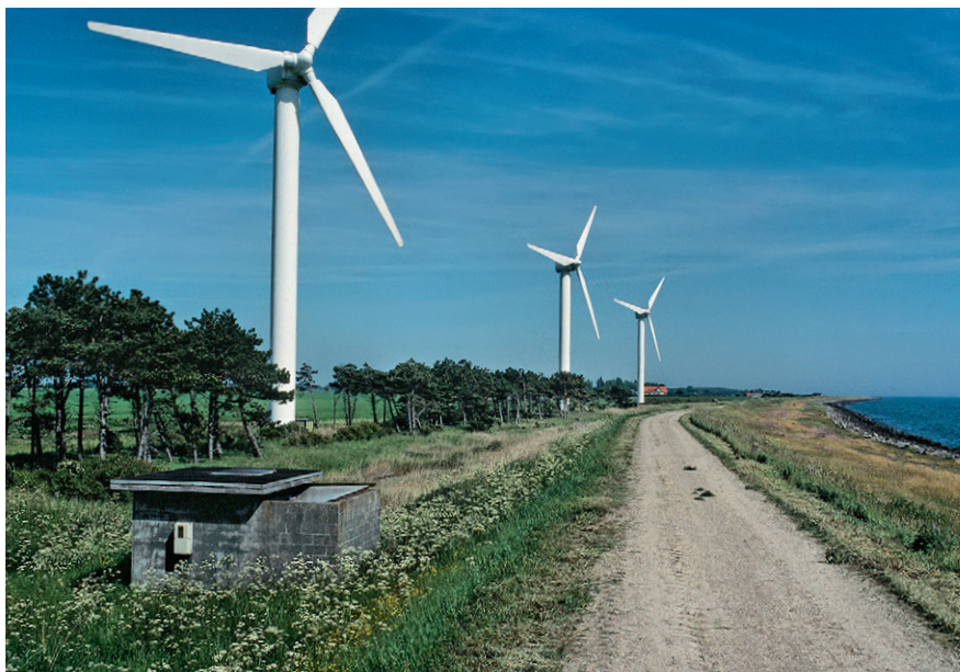
Her står tre af de 30 meter møller i Kappel Vindmøllepark, der blev taget ned i 2012. Nu er syv 150-200 meter høje forsøgsmøller på vej. Det historiske billede er fra 7. juni 2006.

Kong Frederik IV en forordning, som oprettede et lotteri med 2600 lodder på hver 100 rigsdaler. Hovedgevinsten var en ladegård med tilhørende fæstebønder på Lolland. Gården blev oprettet af ni bøndergårde i landsbyen Knuppelykke, der dengang var kongens gods.