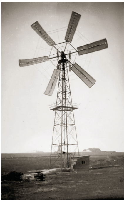
I 1928 blev det besluttet at etablere kunstig afvanding ved hjælp af en vindmølle. Den gjorde nytte helt frem til 1950. Børnene havde deres egen glæde af den. Om vinteren satte drengene møllen i stå, og der opstod en kæmpestor skøjtebane, hvor flere hundrede mennesker løb på skøjter.

for aftalen, og selv blandt lodsejerne var der knurren. De egentlige tabere blev dog de fattige i Sejerslev sogn, fordi Sejerslev Fattigkommission stod til at miste sin årelange hævd på at lade sognets allerfattigste hente gratis hø og tørv ved søen.