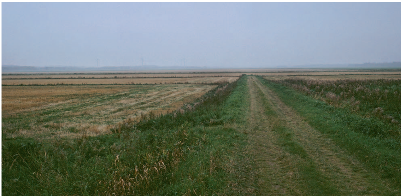
Den udtørrede søbund ligger den dag i dag træløs hen. Her er hverken læhegn eller vildtplantninger, men uhindret udsyn som i gamle dages Nordjylland. Ude i horisonten skimtes et par af de fem store NEG Micon vindmøller, som den nuværende ejer har rejst.