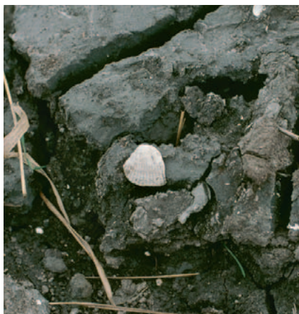
Overalt i den fede dyndjord ligger der stadig århundredegamle hjertemuslinger fra dengang, hvor Gårdbø Sø stod i forbindelse med havet.